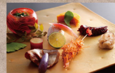
【逸品】淡路島西浦の地魚や淡路牛を 味わう季節の逸品懐石・淡路野菜とともに

【料金】 大人1名様 25,300円～(サ料・消費税込) 【内容】 2食付(夕食・朝食)