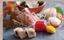
【特選】旬秋鮑を味わう秋の味覚づくし 会席～淡路牛・紅葉鯛ほか秋の山海の幸とともに～

【料金】 大人1名様 19,800円～(サ料・消費税込) 【内容】 2食付(夕食・朝食)