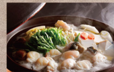
冬の旬を味わう「淡路島3年とらふく」 てつちり鶏プラン

【料金】 大人1名様 24,200円～(サ料・消費税込) 【内容】 2食付(夕食・朝食)