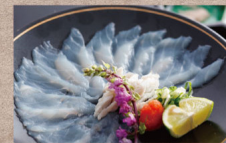
「冬の味覚づくし」淡路島3年とらふく をフルコースで味わうふくづくし会席

【料金】 大人1名様 22,550円～(サ料・消費税込) 【内容】 2食付(夕食・朝食)