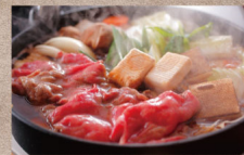
【秋特撰】淡路牛と松茸のすき焼きと紅葉鯛・伊勢海老の姿造りプラン

淡路島は知る人ぞ知る黒毛和牛の名産地。高ブランドとして名を馳せる淡路牛は細かく筋織りと甘みのあるリッチな味わいで、火を通すとリッチな味わいで柔らかく良い舌触り。本プランでは秋の特産、松茸と共に料理長自慢の献上にこだわったすき焼きをお召し上がりいただけます。他にも脂の乗った紅葉鯛やぶりの伊勢海老・穴子など、秋の味覚をご堪能ください。