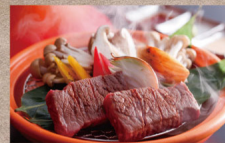
淡路牛宝菜ステーキと南あわじの地魚を 味わう複食コース・目にも鮮やかな島 育ち野菜とともに

【料金】 大人1名様 26,400円～(サ料・消費税込) 【内容】 2食付(夕食・朝食)