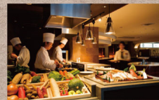
四季彩ダイニング浜屋 選べるメイン料理 ★四季のパスシャレ★ ★デザートアップ付

【料金】 大人1名様 27,500円～(サ料・消費税込) 【内容】 2食付(夕食・朝食)